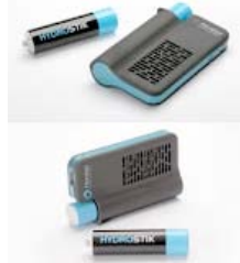
Baterías de hidrógeno

Mucho hemos oído hablar del grafeno, sustancia revolucionaria que seguramente marcará una gran transformación en la industria. Se ha descubierto que cubrir el silicio de una batería con grafeno provoca que dure diez veces más y se cargue en apenas quince minutos. Aunque todavía está en fase de desarrollo, seguramente pronto estas baterías estarán en nuestras manos. Las baterías de grafeno son 5 veces más efectivas que algunas actuales, incluso después de 150 cargas.