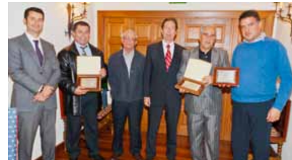
Representantes de las tres estaciones de servicio premiadas junto a responsables del Grupo Disa.

Nada se logra sin esfuerzo ni dedicación. Este Premio no hubiese llegado a nuestras manos sin el valioso trabajo que día a día realizan nuestros empleados, quienes entregan su quehacer cotidiano para que esta Cooperativa continúe por el camino de la eficiencia, la responsabilidad y el trabajo bien hecho, siempre en beneficio de nuestro sector. Especialmente queremos agradecer a nuestros socios por estar siempre presentes en cada